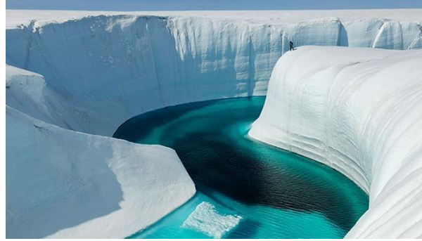
Fonte des glaces au Groenland, Birthday Canyon

L'arctique et le désert... deux régions mystiques, étendues infinies de glace et de sable, regorgeant de tant de richesses, et revêtant une importance stratégique majeure. L'exploitation de l'une débuta depuis presque un siècle, et la seconde vit la course à l'investissement des grandes puissances, impatientes de tirer avantage de la fonte des glaces due au réchauffement climatique qui affecte l'Arctique deux fois plus que la moyenne mondiale 1 : Opportunités économiques, routes maritimes, ressources naturelles et énergétiques, vie marine, matières premières, expéditions scientifiques, militarisation et rapports de force.