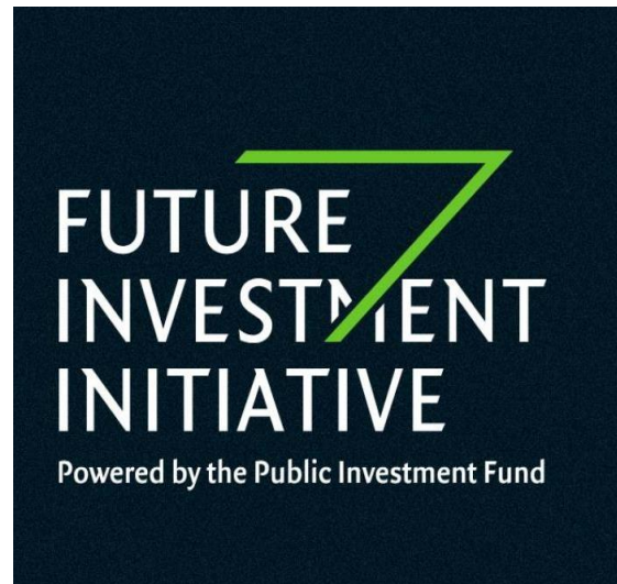
"Future Investment Initiative" surnommé Davos du désert

Christine Lagarde (Directrice générale du Fonds monétaire international), l'Electricité de France 26 , Uber, Harbour Group, Brookings Institution, et les médias (à l'exception de Fox Business Network) 27 ont annulé leur participation et boycotté le forum international sur l'investissement « Davos du désert » ayant lieu à Riyad entre le 23 et le 25 octobre, une vague d'investisseurs russes 28 ont joint le forum notamment Kirill Dmitriev, PDG du fonds russe d'investissements directs (RDIF) qui a décrit lors de son discours, le plan de réformes et de développement de MBS « Vision 2030 » de véritablement historique. 29