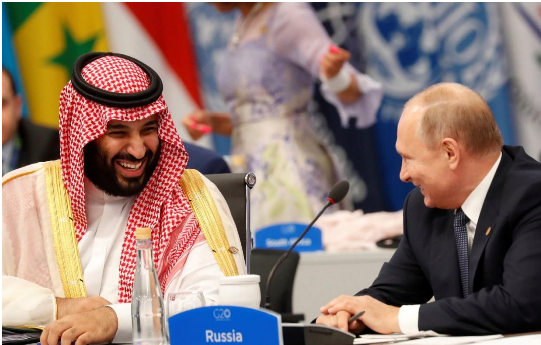
MBS et Vladimir Putin au Sommet du G20

Il est également dans l'intérêt de la Russie d'être en bon termes avec le Royaume afin d'accroître son influence et de mieux s'implanter dans le monde Arabo-Musulman à majorité Sunnite.