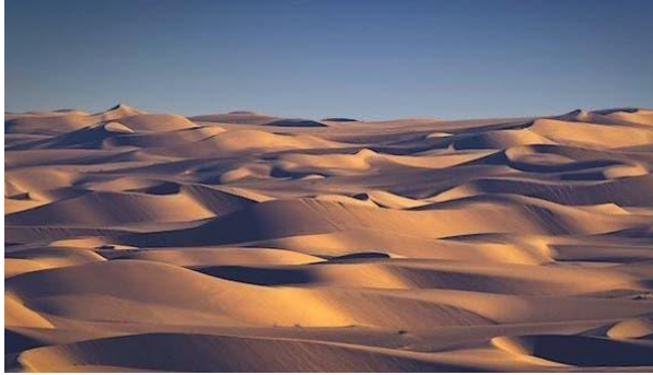
Dunes en Arabie Saoudite