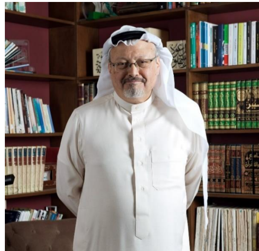
Jamal Khashoggi

Ce rapprochement atteint son apogée suite à la réaction Russe au meurtre du journaliste Jamal Khashoggi le 2 octobre 2018 à Istanbul : Tandis que les Etats occidentaux, y compris les Etats-Unis, allié historique et principal du Royaume, ont sévèrement dénoncé ceci, Putin n'a rien reproché à l'Arabie et a déclaré : « En vérité, nous ignorons ce qui s'est passé. Alors, pourquoi devrions-nous prendre des mesures qui pourraient nuire à nos relations avec l'Arabie Saoudite ? » 24 ; et pendant que des principaux participants Occidentaux tels Jamie Dimon PDG de JPMorgan Chase 25 , HSBC, Siemens,