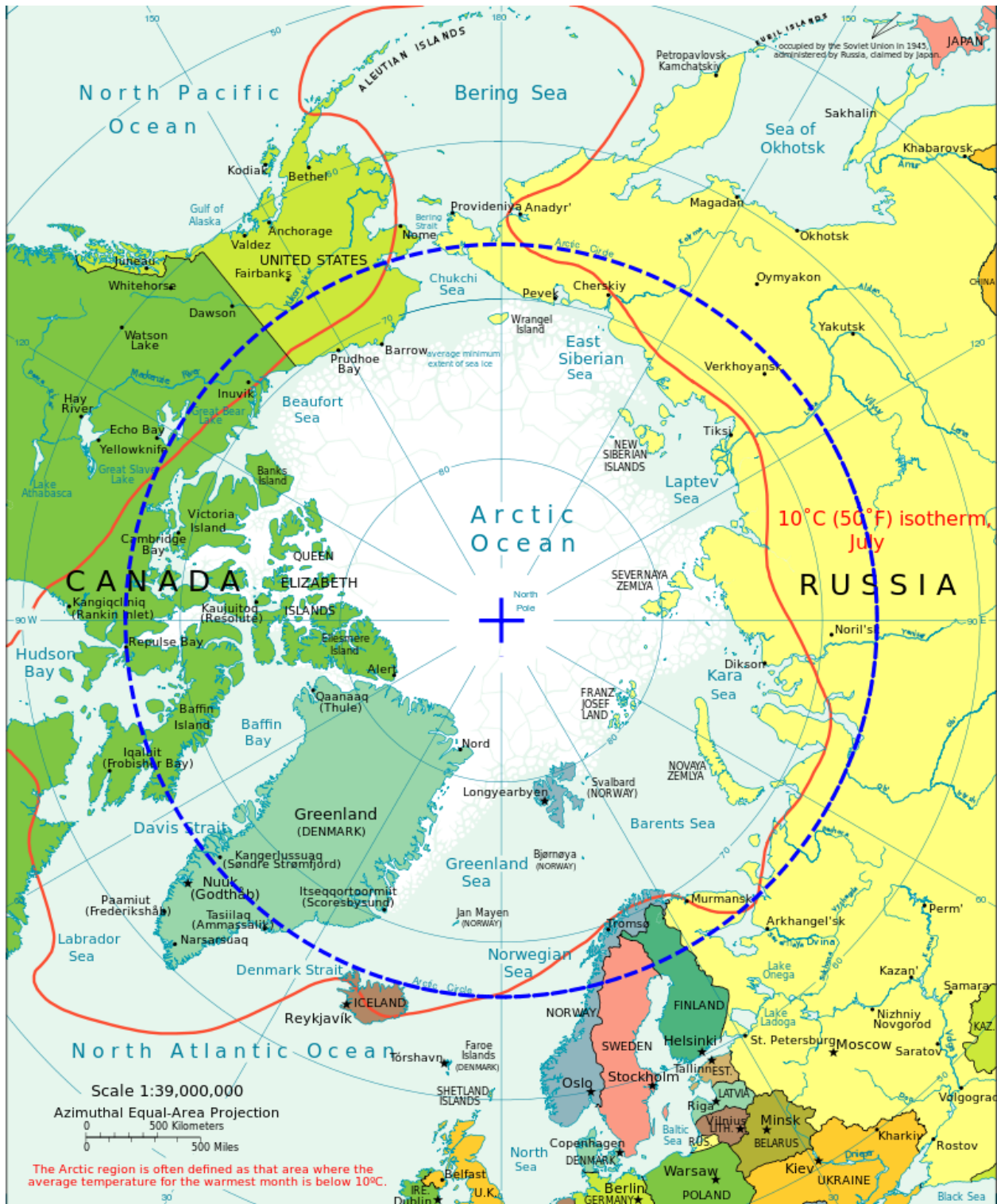
L'arctique et le cercle arctique